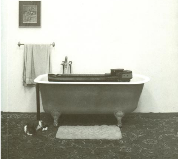
Jimie Durham Zwischen Mobiliar und Haus p.102 ff

Between the Furniture and the Building (Between a Rock and a Hard Place) Zwischen Mobiliar und Haus (Im Gestein der Zwickmühle)